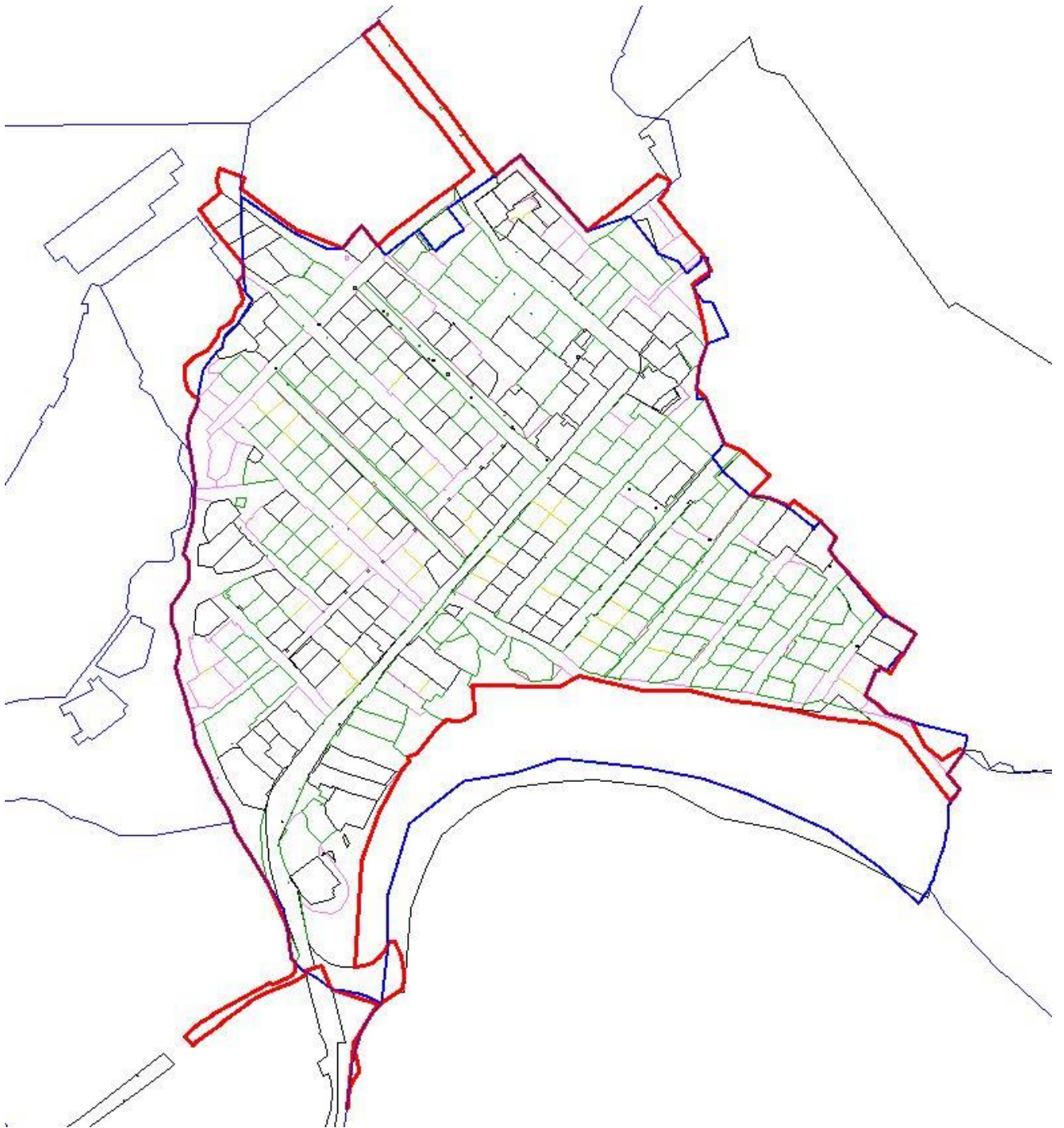
Рис. 2. Местоположение территории проектирования

Площадь территории в утвержденных границах проектирования составляет 397191 кв.м. (39,72 га).