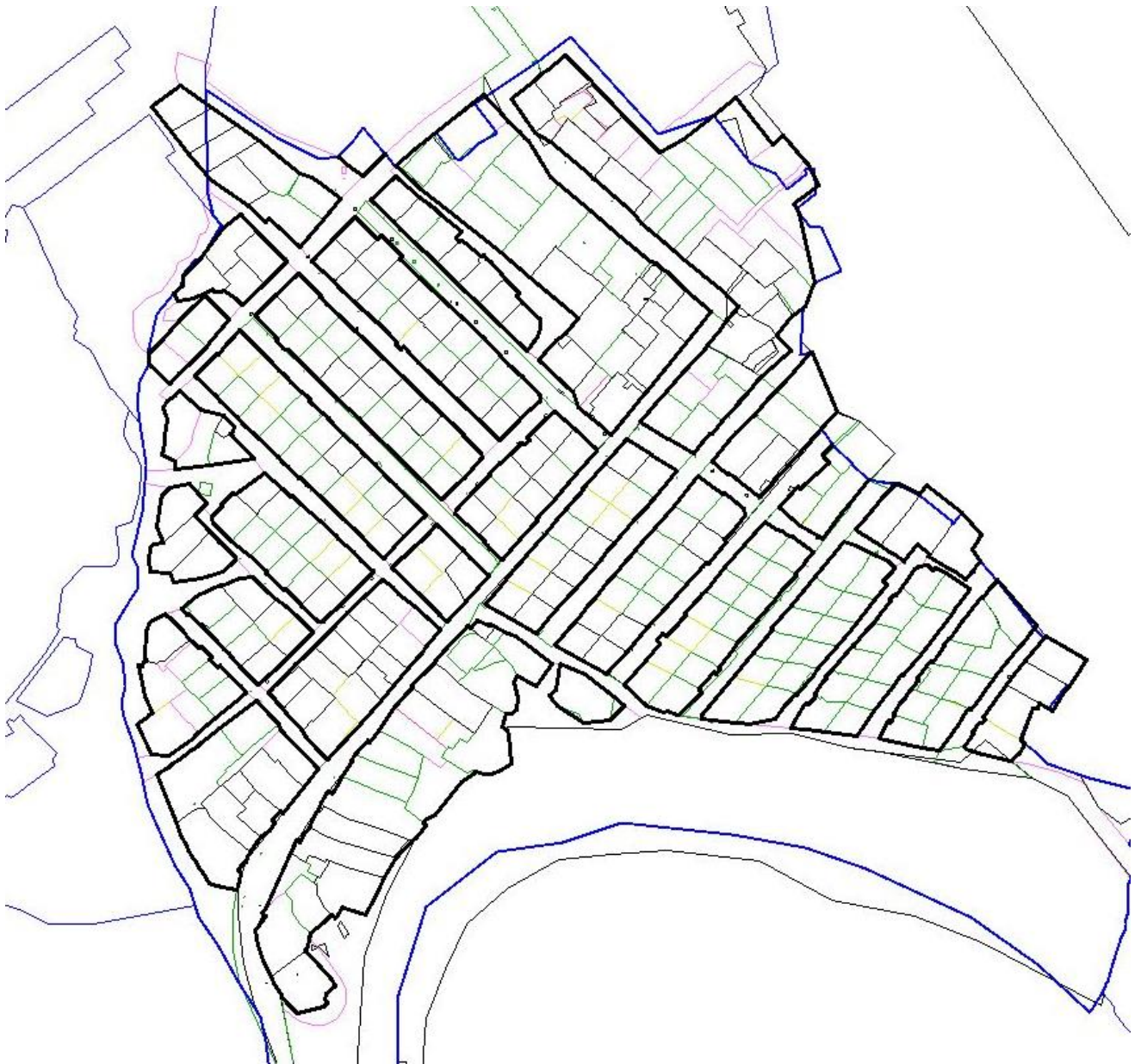
Рис.4. Местоположение утверждаемых красных линий