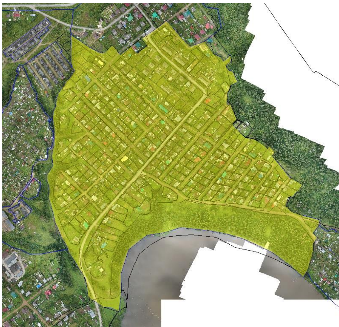
Рис. 1. Местоположение территории кадастрового квартала 59:18:0010203

Территория проектирования ограничена территорией кадастрового квартала 59:18:0010203. Местоположение территории кадастрового квартала представлено на рисунке 1, местоположение территории проектирования представлено на рисунке 2.