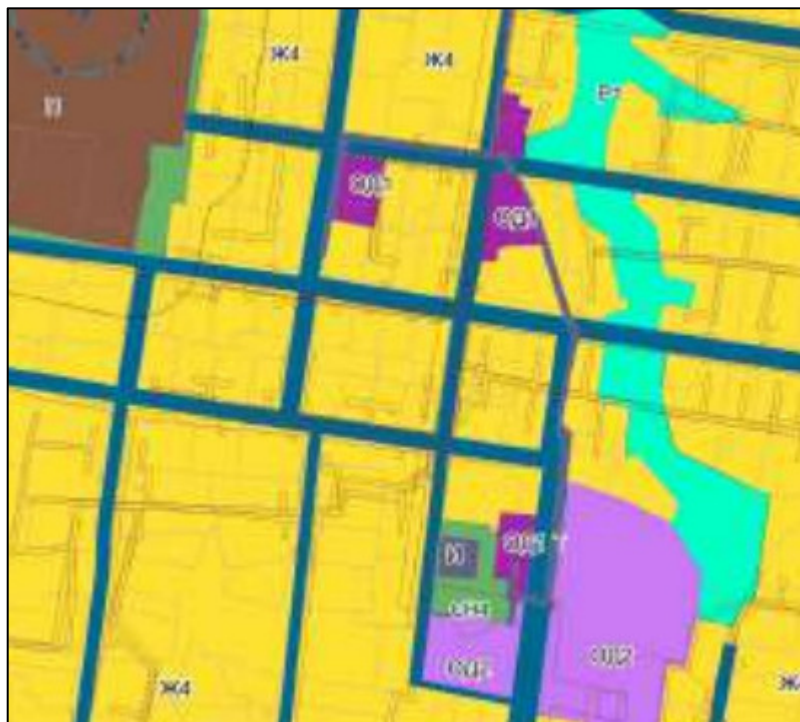
Рис. 2 – Фрагмент Карты градостроительного зонирования п. Дивья.

Градостроительным регламентом территориальной зоны застройки индивидуальными жилыми домами (Ж-4) установлены основные, вспомогательные, условно разрешенные виды разрешенного использования земельных участков и объектов капитального строительства.